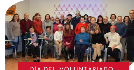
DÍA DEL VOLUNTARIADO.