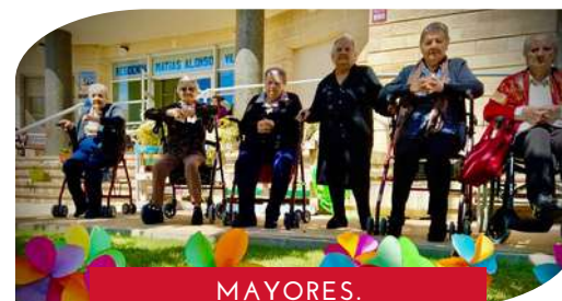
MAYORES. DÍA DEL BUEN TRATO.