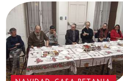
NAVIDAD. CASA BETANIA.