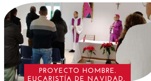
PROYECTO HOMBRE. EUCARISTÍA DE NAVIDAD.