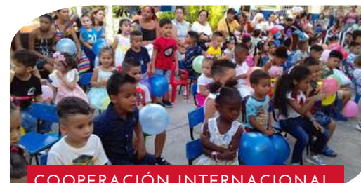
COOPERACIÓN INTERNACIONAL. GUARDERÍA EN CUBA.