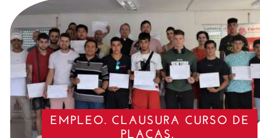
EMPLEO. CLAUSURA CURSO DE PLACAS.