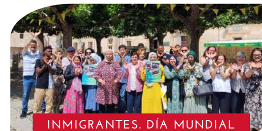
INMIGRANTES. DÍA MUNDIAL DEL REFUGIADO.