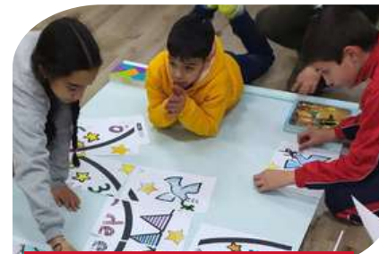
INFANCIA. DÍA DE LA PAZ.

Proyecto digital. Incluye formación en aulas especializadas, un servicio de préstamo de equipos y un aula móvil pensada para personas mayores o residentes de zonas rurales.