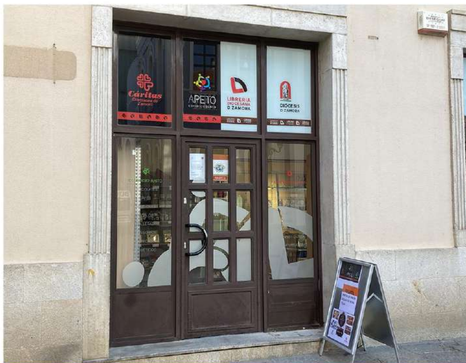
Fachada de la tienda situada frente al teatro Ramos Carrión

Una nueva página en nuestra pequeña historia que va siendo cada vez más amplia, desde aquel septiembre de 2017 en el que empezó su andadura el comercio justo en nuestra entidad. Esperemos que se sigan escribiendo muchas.