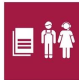
8.B. Estrategia mundial para el empleo juvenil

Promover el crecimiento económico sostenido, inclusivo y sostenible, el empleo pleno y productivo, y el trabajo decente para todos