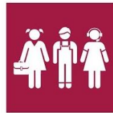
8.6. Jóvenes con trabajo y estudios