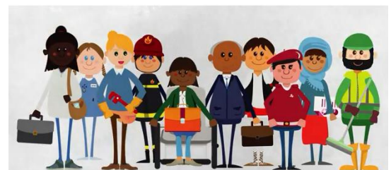
Vídeo UNESCO ODS8 Trabajo Decente y Crecimiento económico

Además de la pérdida de millones de vidas humanas, la pandemia por la COVID-19 ha provocado una recesión histórica con niveles récord de carencias y desempleo, lo que ha creado una crisis humanitaria sin precedentes cuyas peores consecuencias las están sufriendo los más pobres. El Fondo Monetario Internacional (FMI) prevé una recesión mundial tan mala o peor que la de 2009. A medida que se intensifica la pérdida de empleo, la Organización Internacional del Trabajo estima que cerca de la mitad de todos los trabajadores a nivel mundial se encuentra en riesgo de perder sus medios de subsistencia.