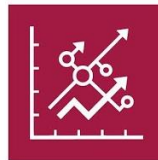
8.2. Diversificación, tecnología e innovación