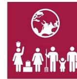
8.9. Promoción turismo sostenible