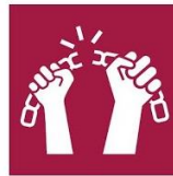
8.7. No esclavitud, trata y trabajo infantil