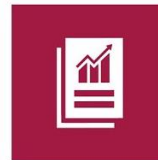
8.3. Fomento pequeña y mediana empresa