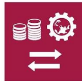
8.A. Comercio en países en desarrollo