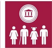
8.10. Capacidad institucional financiera