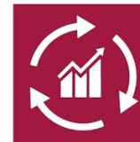
8.4. Producción y consumo eficiente y respetuoso