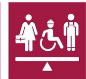
8.5. Pleno empleo y trabajo decente