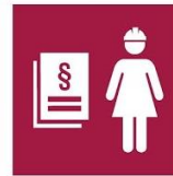
8.8. Protección Derecho labora y seguro