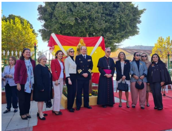
Foto 3 Monumento a Nuestra Señora la Virgen del Carmen

El sábado 25 de noviembre, a mediodía, se ofició la Santa Misa en el Patio de Armas del Arsenal de Cartagena y a su finalización, el arzobispo castrense procedió a la bendición del nuevo Monumento a Nuestra Señora la Virgen del Carmen, patrona de la Armada y de las demás Marinas, y que se ha ubicado en el mencionado Patio de Armas.