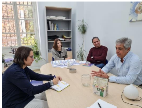
Foto 4 Reunión Servicios Sociales Ayto. Cartagena