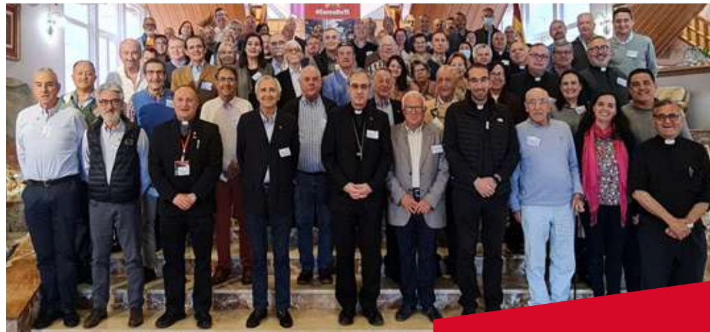
Asamblea General de Cáritas Castrense (2022)