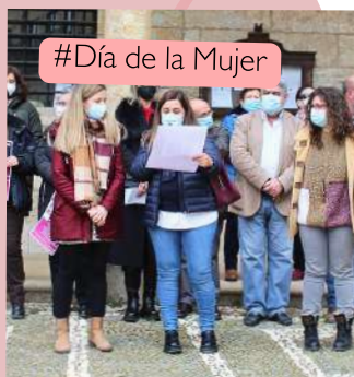
#Día de la Mujer