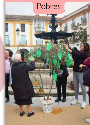
#Jornada Mundial de los Pobres