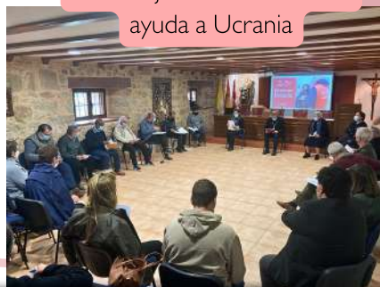
#Consejo Pastoral sobre la ayuda a Ucrania