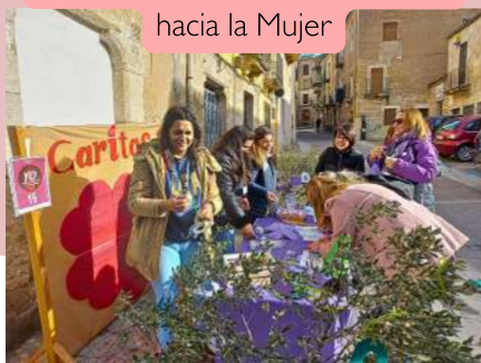
#Ruta urbana contra la violencia hacia la Mujer