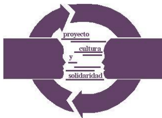
Proyecto Cultura y Solidaridad