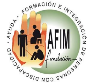
Fundación AFIM Salamanca