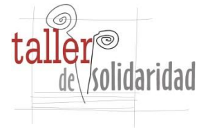
Taller de Solidaridad