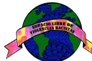
Asociación Cultural Talloc