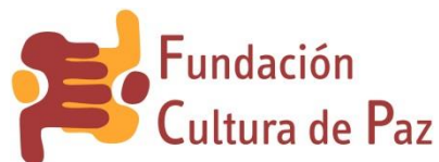
Fundación Cultura de Paz