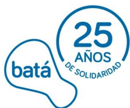
Centro de Iniciativas para la Cooperación