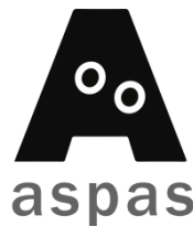
Asociación de Padres de Niños Sordos Salamanca