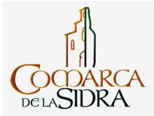
Mancomunidad Comarca de la Sidra (Asturias)