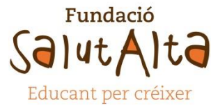
Fundació Salut Alta