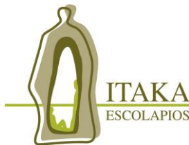
Itaka Escolapios Euskadi