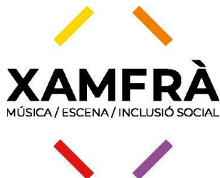
Xamfrà, Música y Escena para la inclusión social