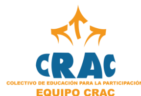
Colectivo de Educación para la Participación - CRAC