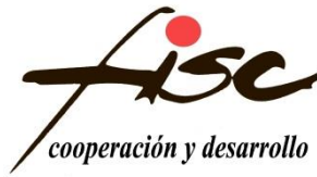
FISC Cooperación y Desarrollo