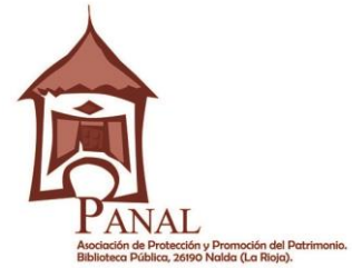
Asociación Panal, La Rioja