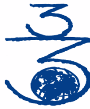
HIRUGARREN MUNDURAKO (La Tercera Edad para el Tercer Mundo)