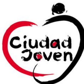
Asociación Ciudad Joven