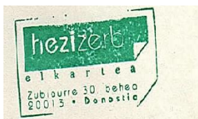
Asociación Hezi Zerb